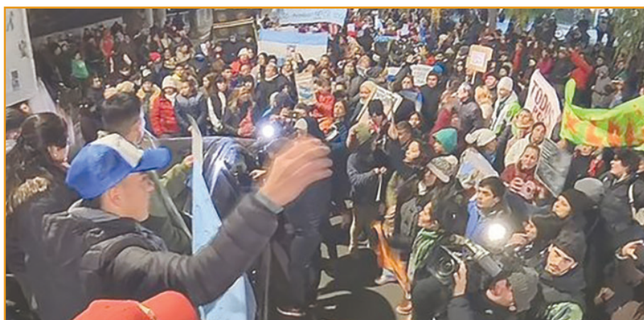
CORRIENTES QUIERE A LOAN CON VIDA. Los vecinos de la localidad se unieron a la caravana para mostrar su apoyo con pedidos concretos al Gobierno para que el niño vuelva a su hogar con vida.