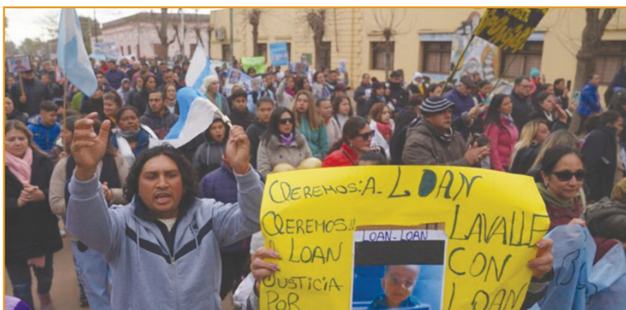
PEDIDO DE JUSTICIA. A la par de las actividades de búsqueda, no cesan las actividades en busca de visibilizar una situación, denunciar el encubrimiento y la impunidad, y pedir castigo para los culpables.