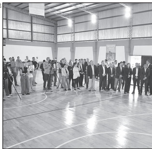
LLENO TOTAL. La pequeña localidad estuvo de fiesta.

En este marco, el mandatario destacó, además, las cuerdas de pavimento concretadas en la localidad hacia el acceso a la misma, lo cual le da a la Comuna "otro empuje y otra