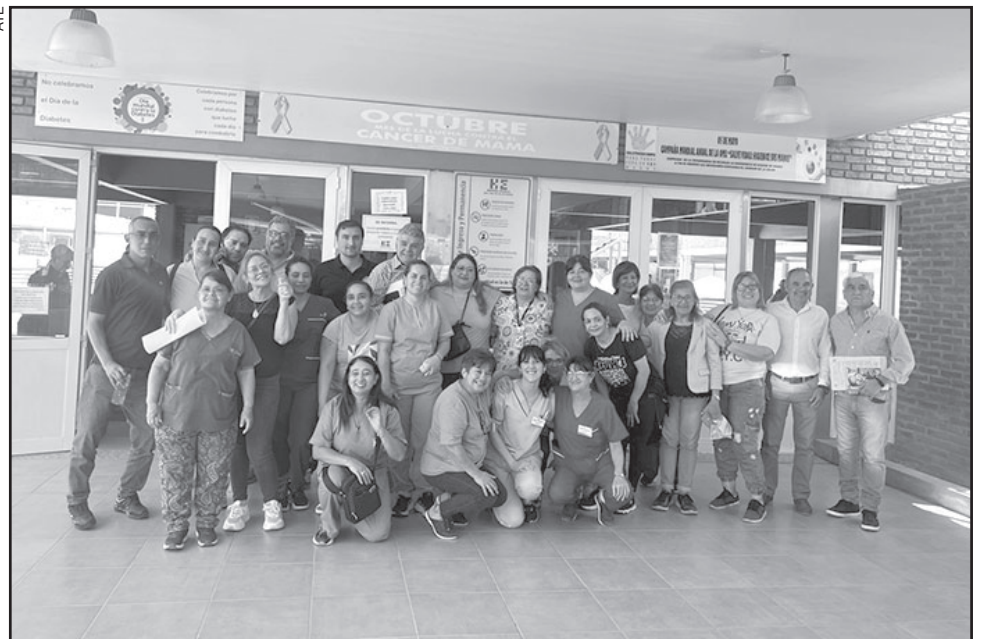
BARAJAR Y DAR DE NUEVO. Retornó la calma en las oficinas del hospital Escuela.

Además de esta situación, el personal arancelado,