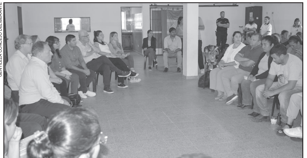
EN LA PREVIA. En la reunión con la comisión vecinal se plasmó el amplio temario.

En este último encuentro se dio el visto bueno a un vasto número de comunicaciones, vinculadas en su gran mayoría a las inquietudes y demandas, planteadas en la reunión preparatoria por los habitantes de los barrios Esperanza, Santa Catalina y Santa Margarita. De ese modo, se solicitó al Departamento Ejecutivo Municipal (DEM) colocación de semáforos, tareas de desmalezamiento, erradicación de basurales, manteni-