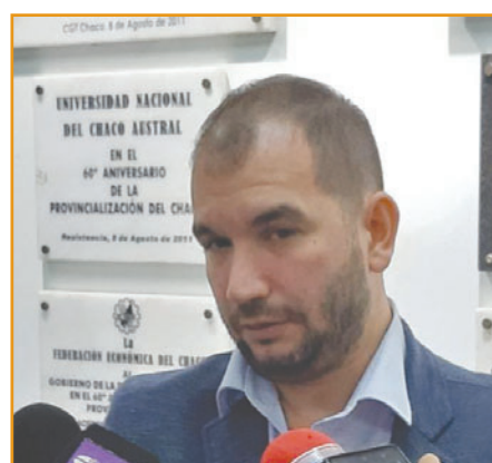
CUESTIÓN DE FONDO. El Defensor denunció a la empresa concesionada por aumentar los precios sin consulta.

zación, iluminación o mantenimiento de las rutas. Es por eso que recurrimos a la Justicia, y obtuvimos esta especie de protección frente a futuros aumentos", explicó.