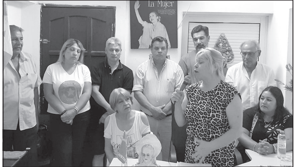
FIEL A LOS PRINCIPIOS PERONISTAS. La candidata subrayó que su experiencia en la participación es clave para asumir este desafío, abogando por un justicialismo unido.

La dirigente peronista lanzó su candidatura para presidir el Partido Justicialista (PJ) de Goya, con un manifiesto comprometido de revitalizar la fuerza en todo el distrito.