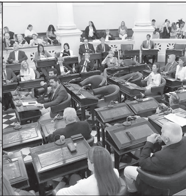
SOBRE LA MESA. Las pérdidas materiales y los daños materiales son contemplados dentro de la iniciativa citada.

afectando la región. Es imperioso declarar la Emergencia Ígnea en todo el territorio provincial, con el fin de adoptar medidas urgentes para combatir, mitigar y prevenir incendios convocando para ello a los organismos competentes y a las autoridades municipales con el