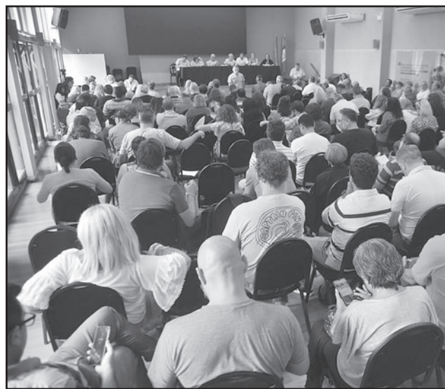
PETICIÓN. Reuniones en Consejo General Educativo.

La organización sindical alineada a la Central de Trabajadores de la Educación de la República Argentina (Ctera) consideró que actualmente las convocatorias se llevan a cabo "en un pasillo del edificio del Consejo General de Educación (CGE)". Por ello, demandó que las asambleas se realicen en "un lugar cómodo y dig-