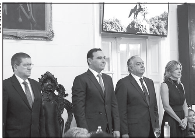
LEGADO. "Vamos a dejar una Provincia infinitamente mejor que la que recibimos, con mejor infraestructura, más moderna, más inclusiva, más sustentable, con sus números en orden".

En su alocución, lanzó tiros por elevación contra la postura crítica de los libertarios respecto a lo que